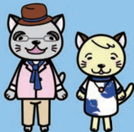
退職会員ニューエブリキャラクター ニューエブリ